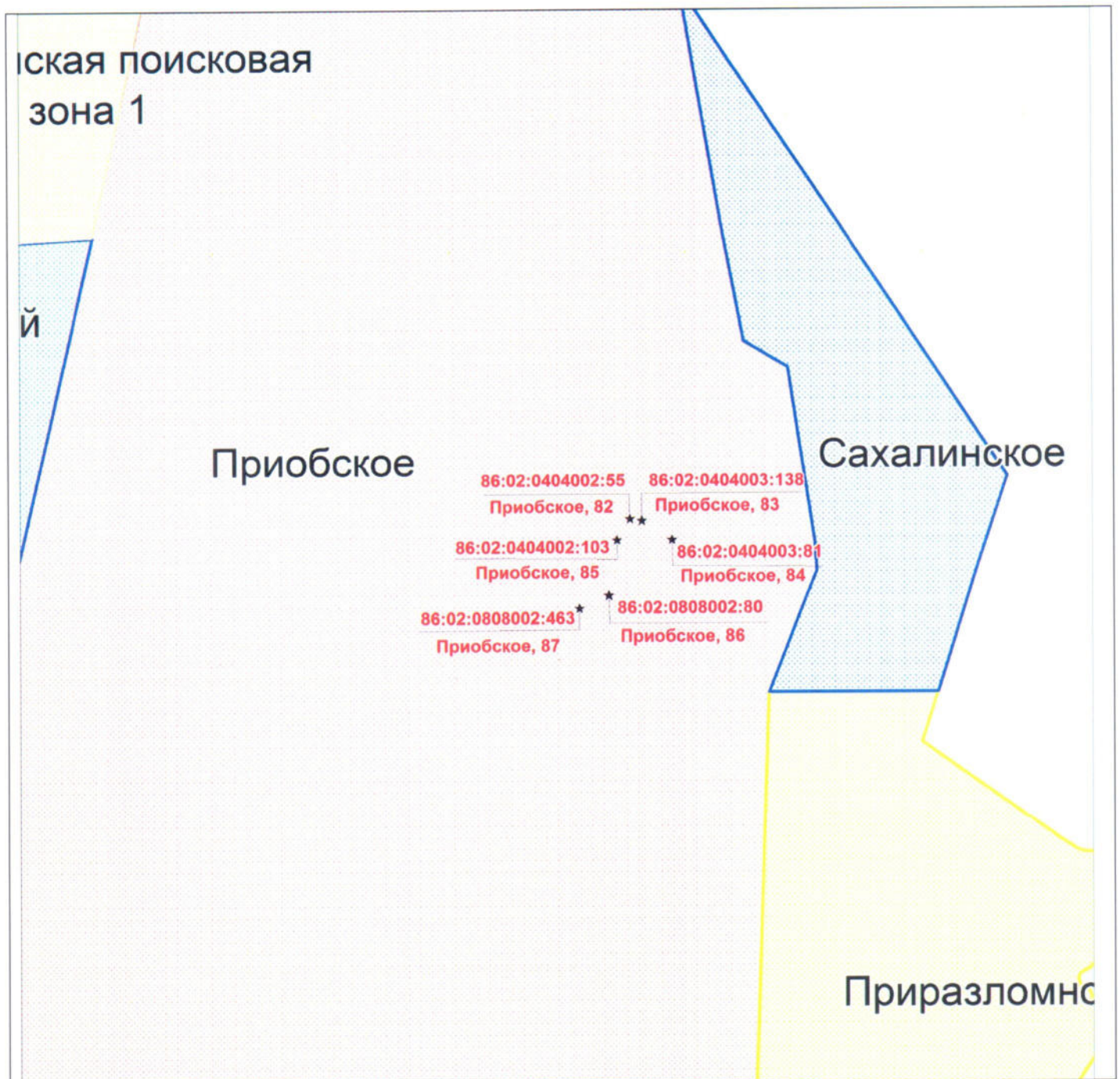
Схема расположения земельных участков на межселенной территории Ханты-Мансийского района